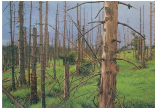
27.2 Όξινη βροχή στην Ευρώπη: ένα οικολογικό πρόβλημα χωρίς σύνορα