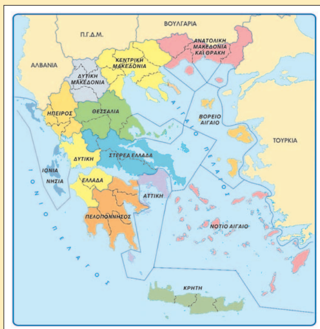
28.2 Διοικητικές περιφέρειες της Ελλάδας