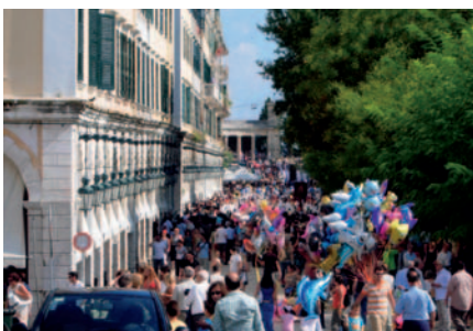
30.7 Περίπατος στην Κέρκυρα σε μέρα γιορτής

Ορισμένα από τα χαρακτηριστικά της Ευρώπης είναι η μεγάλη μέση πληθυσμιακή πυκνότητα σε σχέση με αυτήν άλλων ηπείρων, η ανομοιόμορφη κατανομή του πληθυσμού στον ευρωπαϊκό χώρο, το υψηλό ποσοστό αστικοποίησης, το έντονο δημογραφικό πρόβλημα και το ισχυρό μεταναστευτικό ρεύμα τόσο μεταξύ των κρατών στο εσωτερικό της ηπείρου όσο και από γειτονικές ηπείρους προς την Ευρώπη.