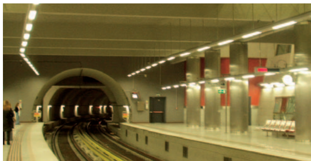
27.3 Το μετρό της Αθήνας