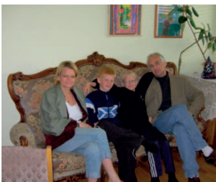
30.6 Οικογένεια με Γερμανό πατέρα και Ισλανδή μητέρα στην Ισλανδία: μια πολυεθνική ευρωπαϊκή οικογένεια