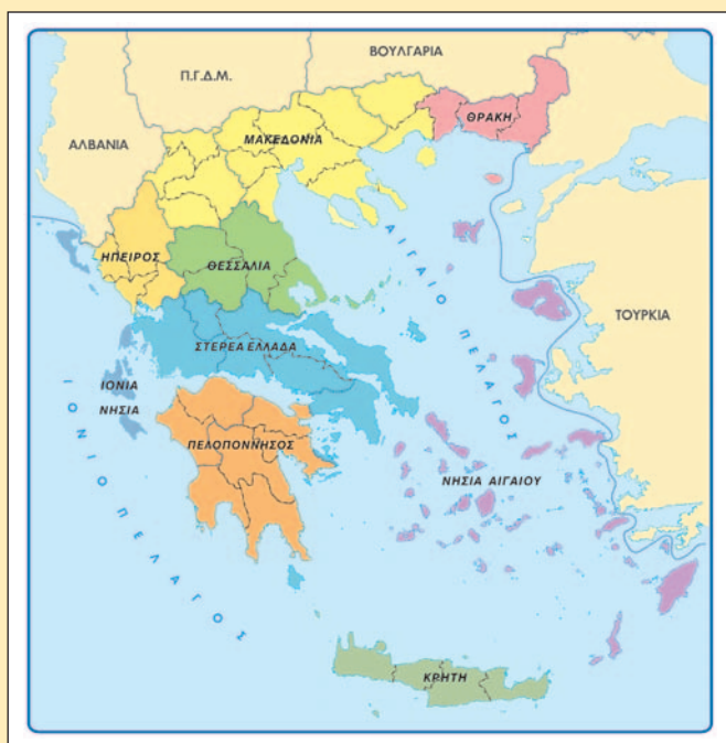
28.1 Γεωγραφικά διαμερίσματα της Ελλάδας

β. Τα 9 γεωγραφικά διαμερίσματα της χώρας μας (π.χ. Νησιά Αιγαίου).