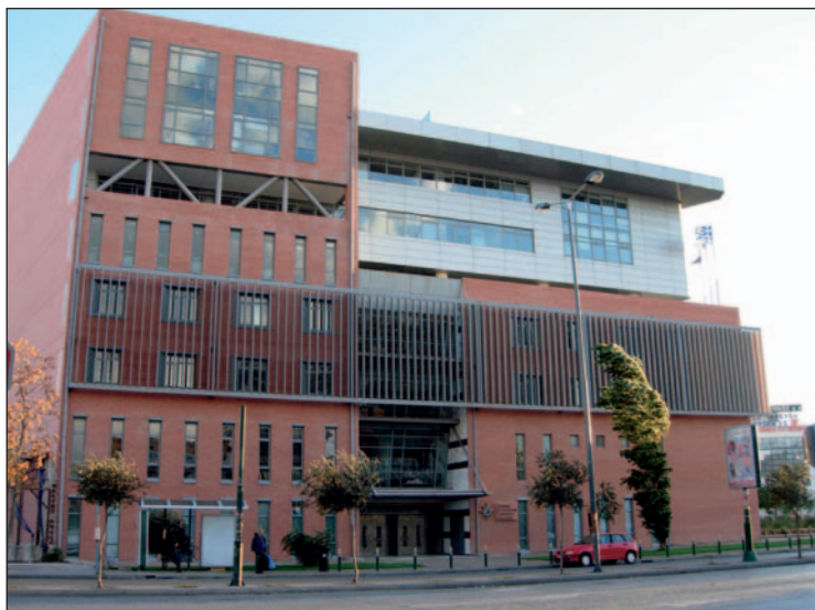
29.4 Στην Ελλάδα στατιστικές διενεργεί η Εθνική Στατιστική Υπηρεσία Ελλάδας (Ε.Σ.Υ.Ε.)

περιόδους (αρχαιότητα, Μεσαίωνα κτλ.). Επομένως οι πληθυσμοί της Ευρώπης που συνήθως παρατίθενται για εκείνες τις περιόδους της ιστορίας της αποτελούν περισσότερο επιστημονικές εκτιμήσεις, που βασίζονται σε διάφορα κριτήρια, παρά ακριβείς μετρήσεις.