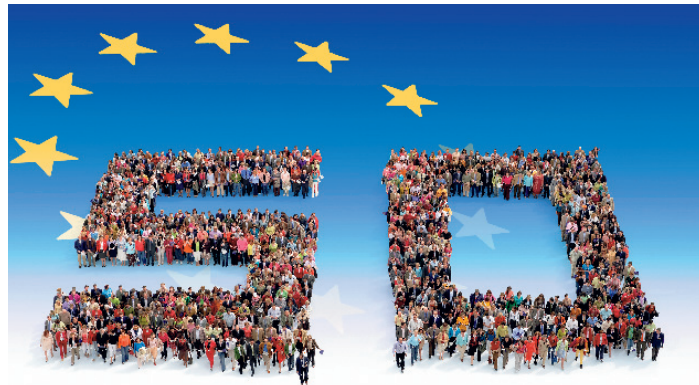
26.4 Από τον εορτασμό των 50 χρόνων της Ε.Ε.

φικη η Πράξη Προσχώρησης της Ελλάδας στην Ευρωπαϊκή Κοινότητα, στην οποία και ενταχθήκαμε από την 1η Ιανουαρίου 1981 ως δέκατο μέλος. Η Ελλάδα είναι ένα από τα 12 κράτη-μέλη που υπέγραψαν τη Συνθήκη του Μάαστριχτ για τη δημιουργία της Ευρωπαϊκής Ένωσης. Το 2004 στην Ε.Ε. εντάχθηκε και η Κύπρος.