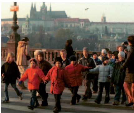
30.5 Μαθητές σε κεντρικό δρόμο της Πράγας