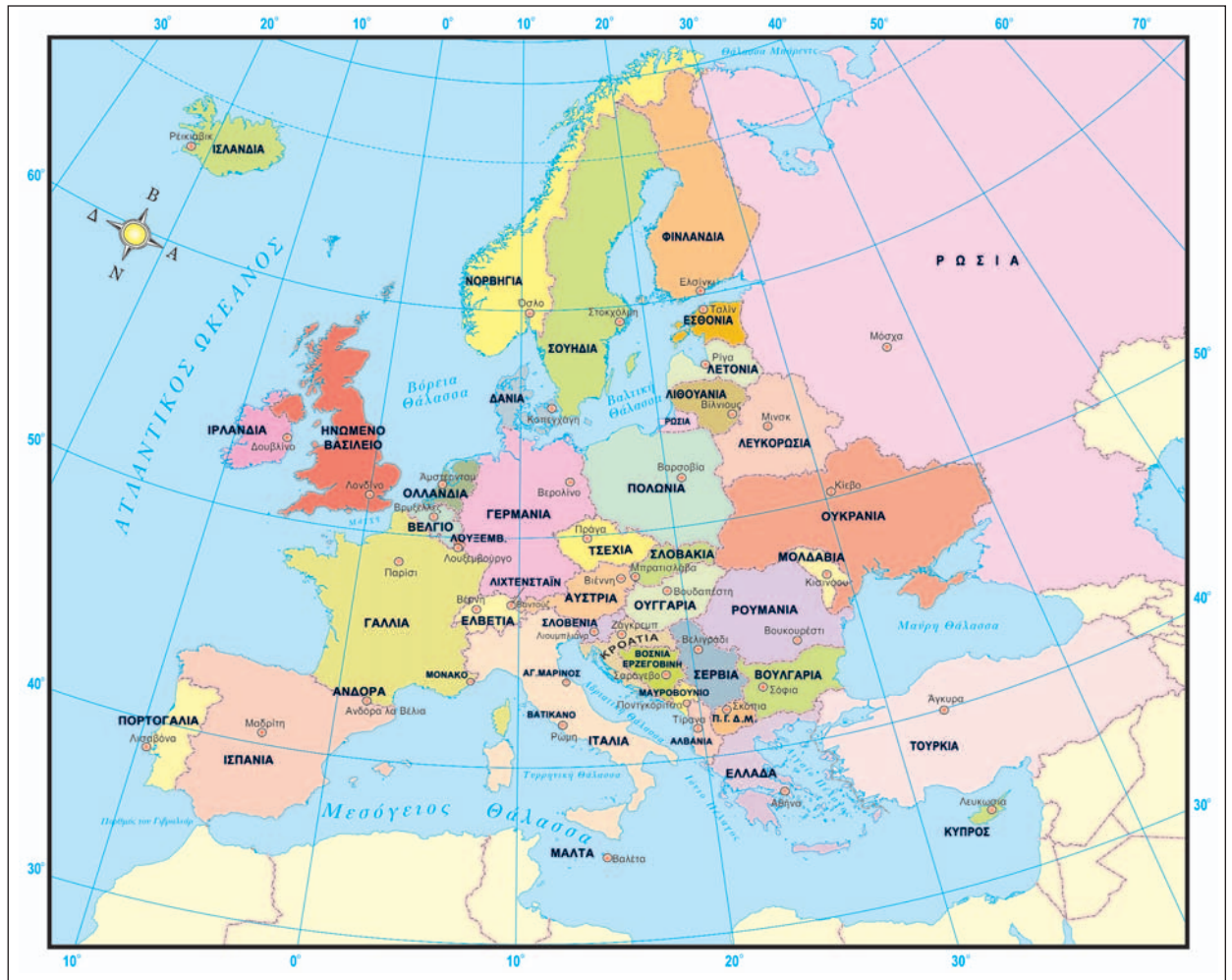
25.1 Πολιτικός χάρτης της Ευρώπης

Γενικά, τα κράτη της ευρωπαϊκής ηπείρου χαρακτηρίζονται από τη μεγάλη ανάπτυξη της βιομηχανικής παραγωγής και του εμπορίου τους, καθώς και από τα πολύ αναπτυγμένα δίκτυα μεταφορών και επικοινωνιών που διαθέτουν. Οι κάτοικοί τους διακρίνονται για τον μεγάλο μέσο όρο ζωής (προσδόκιμο όριο ζωής), τον υψηλό βαθμό μόρφωσης (παράλληλα με τα πολύ χαμηλά ποσοστά αναλφαβητισμού) και το καλό επίπεδο ιατρικής περίθαλψης. Ωστόσο, υπάρχουν σημαντικές διαφορές μεταξύ των ευρωπαϊκών λαών ως προς το επίπεδο της ανθρώπινης ανάπτυξης. Ο πλούτος του εδάφους, η καλή γεωγραφική θέση, το πολιτικό σύστημα και άλλοι λόγοι μπορούν να ερμηνεύσουν αυτές τις διαφορές, οι οποίες με την πάροδο του χρόνου μειώνονται, χωρίς όμως να εξαλείφονται. Βέβαια και μέσα στα ίδια τα κράτη παρατηρούνται μεγάλες διαφορές ως προς το βιοτικό επίπεδο και το επίπεδο ανθρώπινης ανάπτυξης, αφού ακόμη και στις πιο αναπτυγμένες και πλούσιες χώρες υπάρχει ένα ποσοστό πολιτών (διαφορετικό σε κάθε χώρα) που ζει κάτω από το όριο της φτώχειας και δε συμμετέχει ισότιμα στην κοινωνική ζωή.