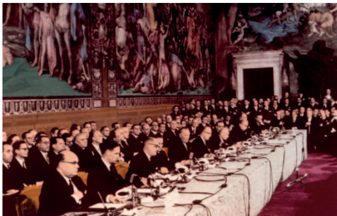
26.3 Μάρτιος 1957: ίδρυση της Ε.Ο.Κ.