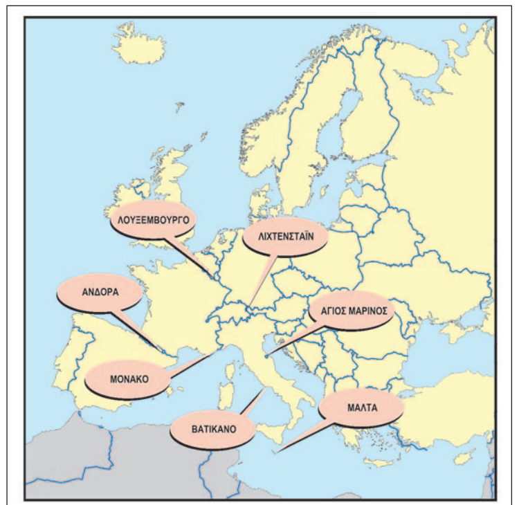
25.2 Χάρτης μικρών κρατών της Ευρώπης

Με βάση τα οικονομικά δεδομένα μπορούμε να διακρίνουμε στην Ευρώπη τρεις μεγάλες ομάδες κρατών: