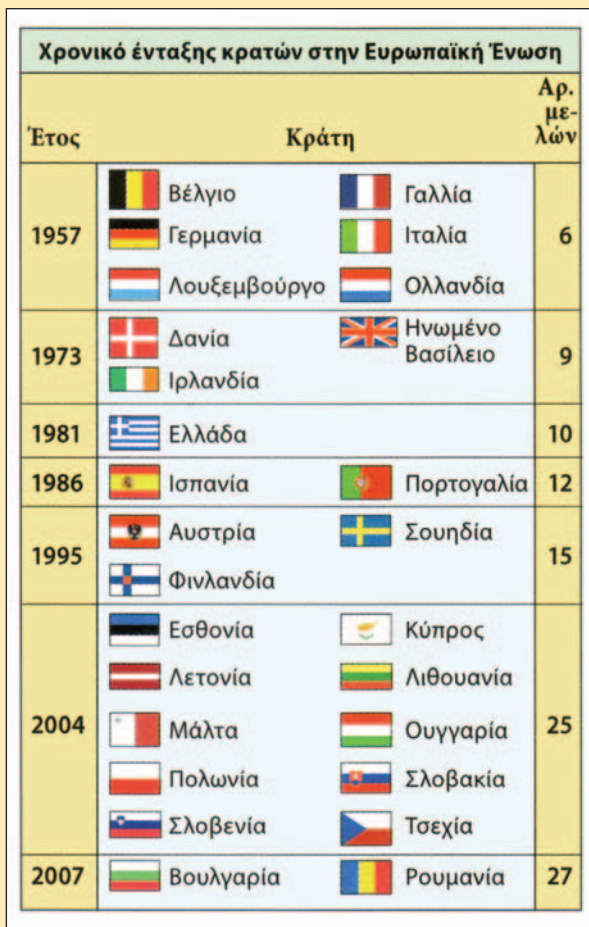
26.2 Χρονολογίες ένταξης των κρατών-μελών της Ε.Ε.