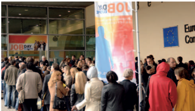
27.1 Εργαζόμενοι συνομιλούν με εργοδότες την Ημέρα της Εργασίας στην Ε.Ε.

Η Ε.Ε. ξεκίνησε το 1957 ως μια οικονομική ένωση έξι κρατών με την ονομασία Ευρωπαϊκή Οικονομική Κοινότητα (Ε.Ο.Κ.). Στην πορεία της, και μετά από έξι διευρύνσεις μέχρι το 2007, η ταυτότητά της άλλαξε αποκτώντας σταδιακά και κοινωνική φυσιογνωμία. Στις μέρες μας πλέον η Ε.Ε. έχει μετεξελιχθεί σε νομισματική, οικονομική, πολιτική και κοινωνική ένωση 27 κρατών, υλοποιώντας δυναμικά την ευρωπαϊκή ενοποίηση. Στη μέχρι τώρα διαδρομή της η Ένωση σημείωσε αρκετά επιτεύγματα, μερικά μόνο από τα οποία είναι τα εξής: