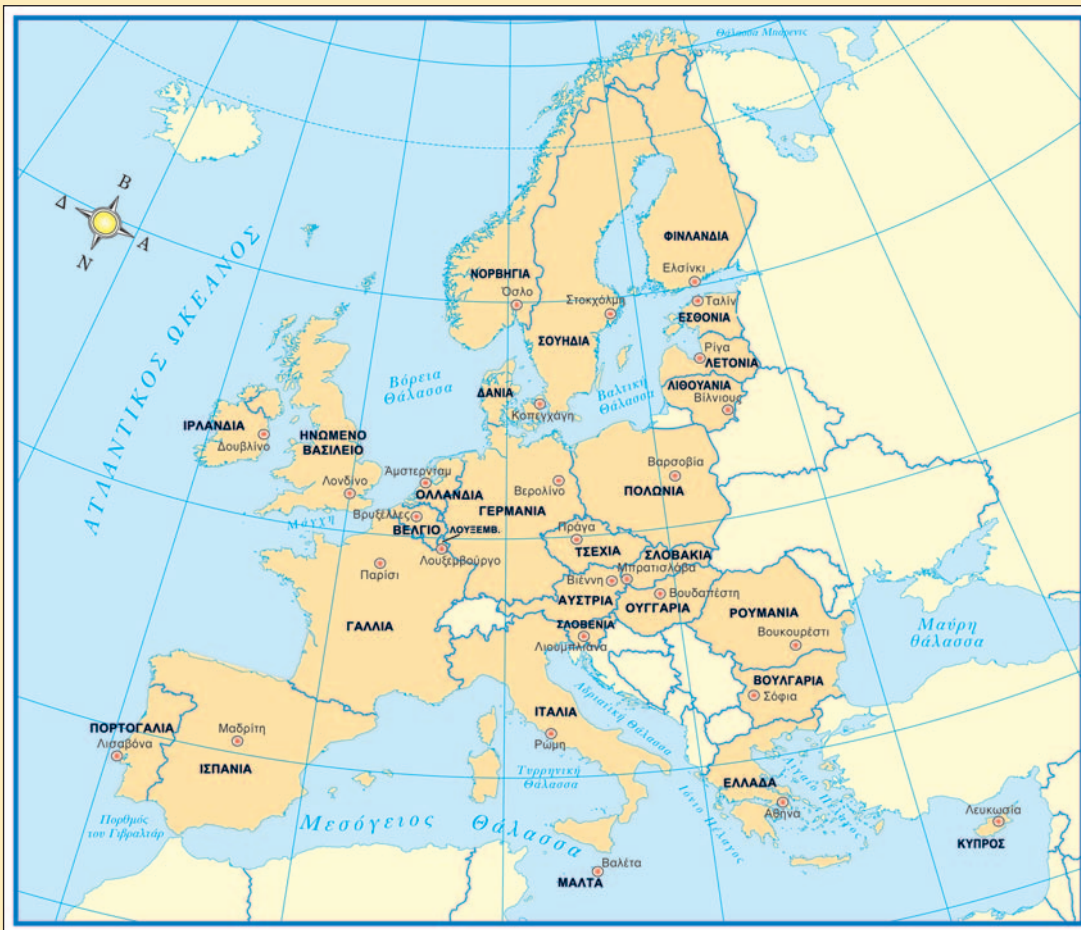
26.1 Χάρτης της Ε.Ε.