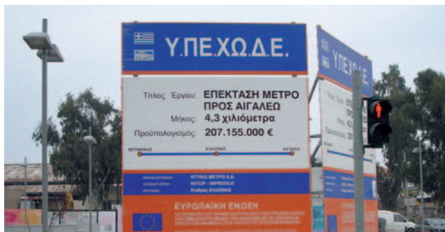
27.4 Πινακίδα κατασκευής σταθμού του μετρό της Αθήνας. Η Ε.Ε. χρηματοδοτεί την κατασκευή του.